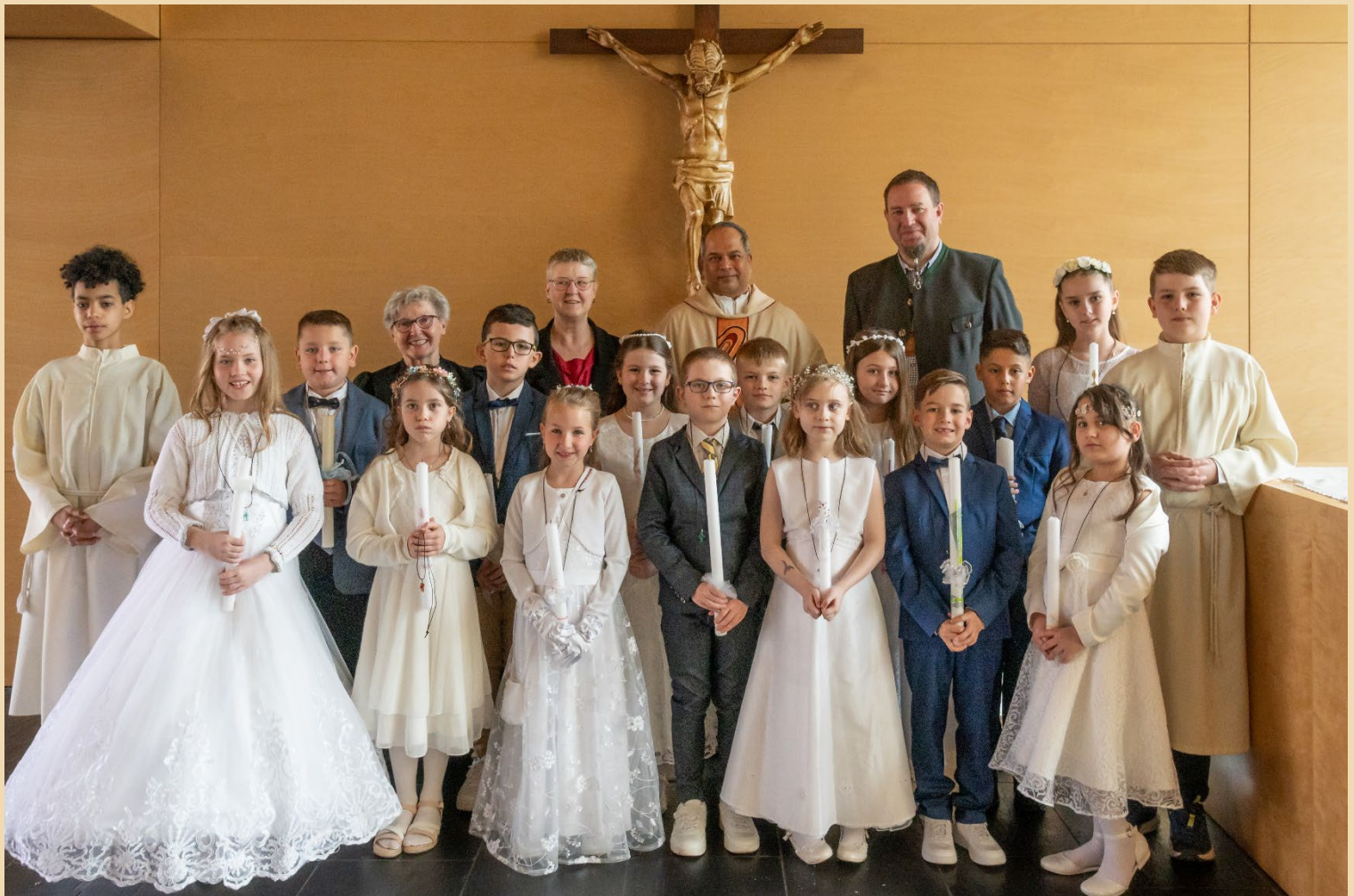
Bild: Erstkommunionsfest der Resthofschule